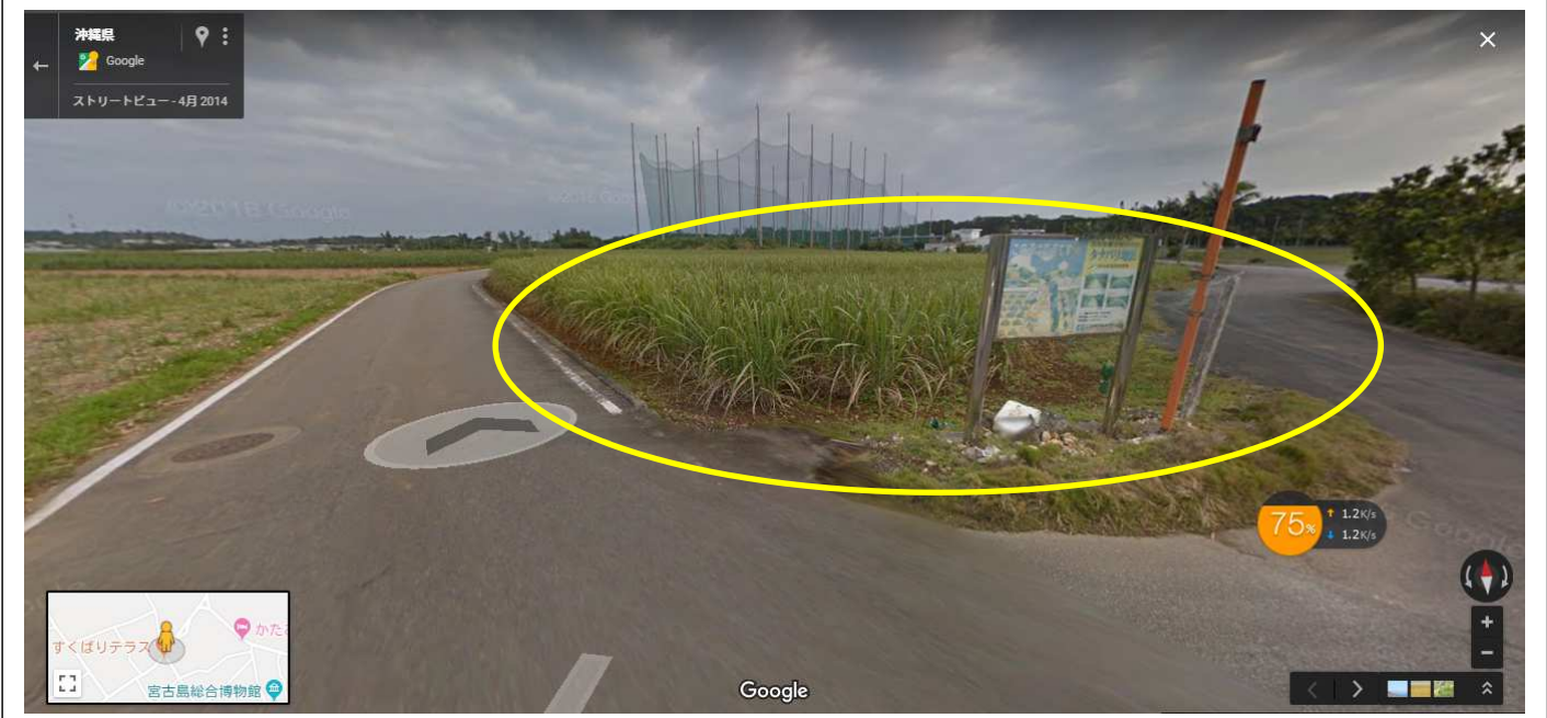
植物園手前約300m。タナバリ土地改良区の看板が目印です。