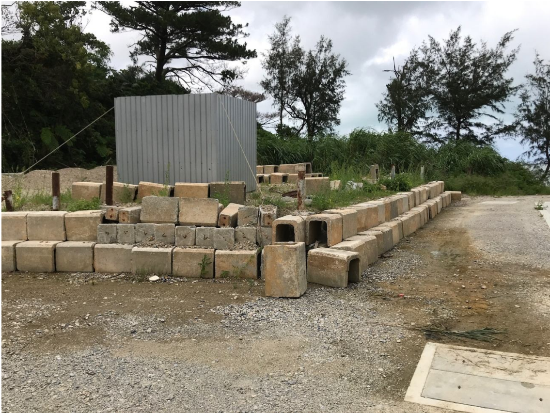
土地のそばの里道から奥武島ビーチに出れます。