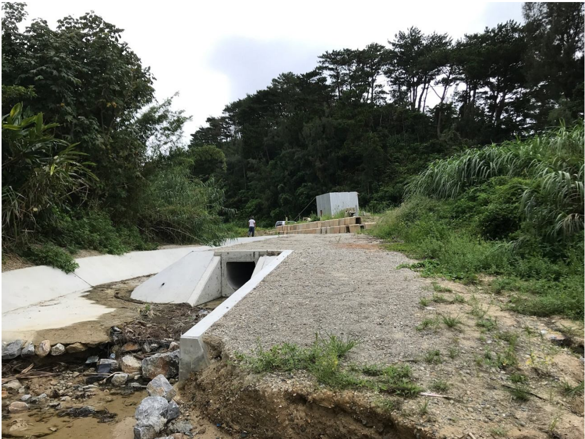
ビーチの方向から物件を写しています。